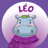
Hippopo 3 à 4 ans