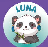
Panda 2 1/2 à 3 ans