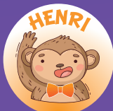
Ouistiti 12 à 16 mois

INSCRIPTIONS-MEMBRES EN LIGNE DÈS LE 12 NOVEMBRE À 8 h 30