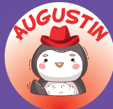
Pingouin 16 à 20 mois