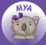
Koala 20 à 24 mois

GROUPES MIXTES Développement des habiletés motrices en s'amusant!