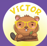
Castor 2 à 2 1/2 ans

Maximum de 10 enfants et parents par groupe.